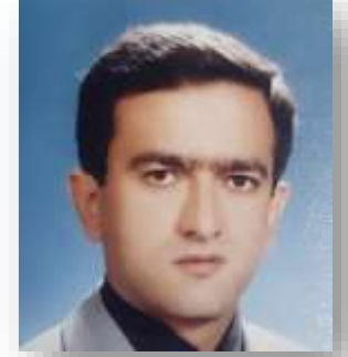
HÜSEYİN ÇELİK (2018-)